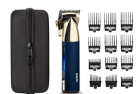
E992E 20 € CASHBACK*